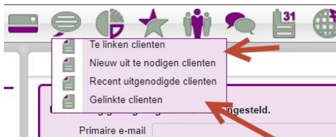
Screenshot 3. Menu zwangerenportaal

Zie het screenshot 3. hieronder voor de beeldvorming: