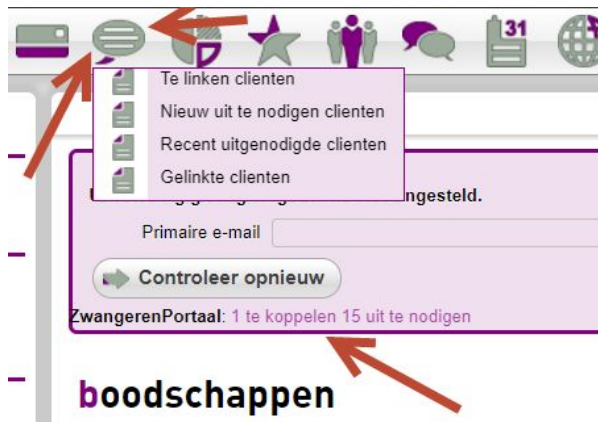
Screenshot 1. Menu optie zwangerenportaal

Vanaf dit moment is het dossier gedeeld met de cliënt en kan zij deze inzien door in te loggen op www.zwangerenportaal.nl .